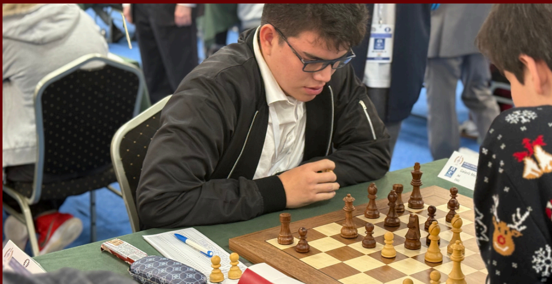
!FIDE WORLD JUNIOR U20 CHAMPIONSHIPS 2025